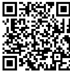
学业水平省级合格性考试成绩证明