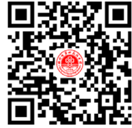
学校服务事项清单