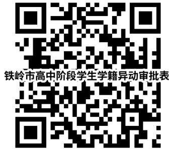
铁岭市高中阶段学生学籍异动审批表

4.1 需提供材料：《铁岭市义务教育阶段学生学籍异动审批表》（资料来源：学校）、身份证（资料来源：办事人）