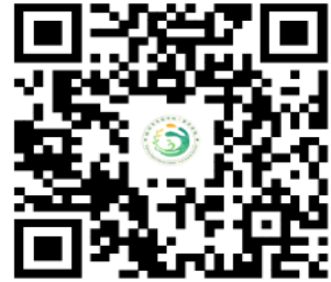
学校服务事项清单