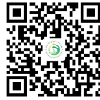
容缺办理事项清单