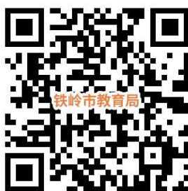
家庭经济困难学生认定申请表

学生本人或监护人应在学校发布公告起的规定时限内自愿提出申请，如实填报综合反映学生家庭经济情况的《家庭经济困难学生认定申请表》。学校根据学生或监护人提交的《申请表》，综合考虑学生日常消费情况以及影响家庭经济状况的有关因素开展认定工作。