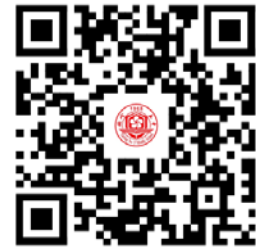
学校服务事项清单